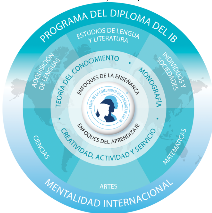
El modelo del Programa del Diploma