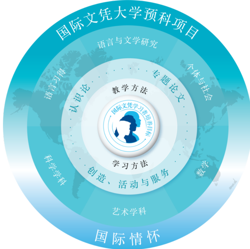
大学预科项目的模式