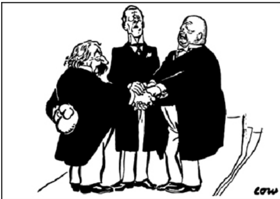
Briand Chamberlain Stresemann

Viñeta de David Low que representa a Aristide Briand, Austen Chamberlain y Gustav Stresemann, extraída del London Evening Standard, 8 de septiembre de 1925. Francia quería fortalecer el acuerdo de la Liga/Sociedad de Naciones con un protocolo que obligase a todos los miembros a acudir en ayuda de cualquier miembro que fuera atacado. Extraída de Europe Since Versailles (Europa desde Versailles), de David Low, Londres, 1940.