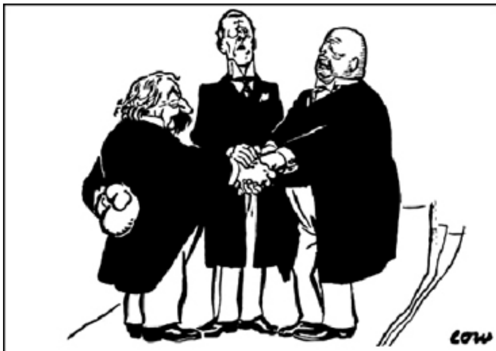
Briand Chamberlain Stresemann

Eine Karikatur von David Low, die Aristide Briand, Austen Chamberlain und Gustav Stresemann darstellt, abgebildet im London Evening Standard, 8. September 1925. Frankreich wollte den Vertrag des Völkerbunds durch ein Protokoll stärken, das alle Mitglieder dazu verpflichten sollte, jedem angegriffenen Mitglied beizustehen. Entnommen aus Europe Since Versailles (Europa seit Versailles) von David Low, London, 1940.