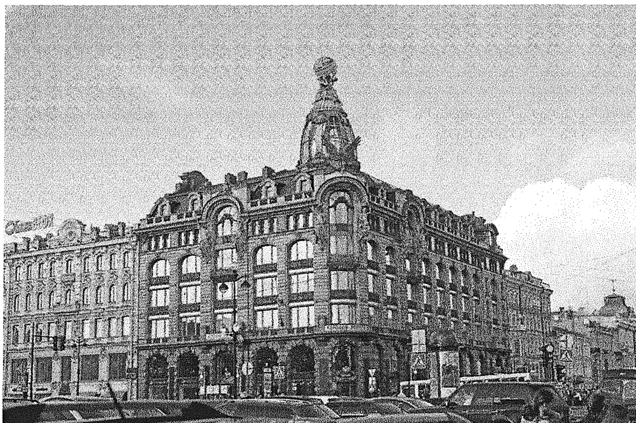
Дом компании «Зингер» 1902