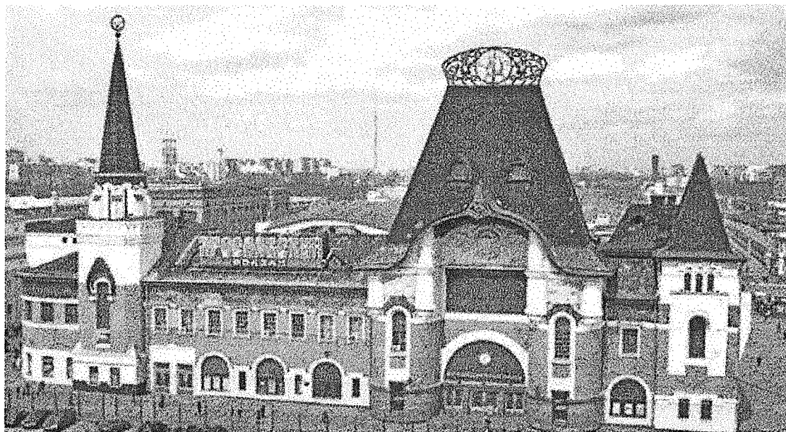
Ярославский вокзал 1902