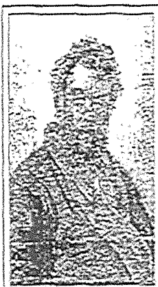
И. Рагин Портрет М. Мусоргского

Во второй половине XIX в. создается творческое объединение «Могучая кучка». В него вошли композиторы Михаил Балакирев, Модест Мусоргский, Александр Бородин, Николай Римский-Корсаков. Они стремились передать в музыке русский национальный характер, поэтому часто обращались к событиям русской истории. Участники «Могучей кучки» привлекали внимание широкой публики к русскому фольклору. Они издали несколько сборников народных песен.